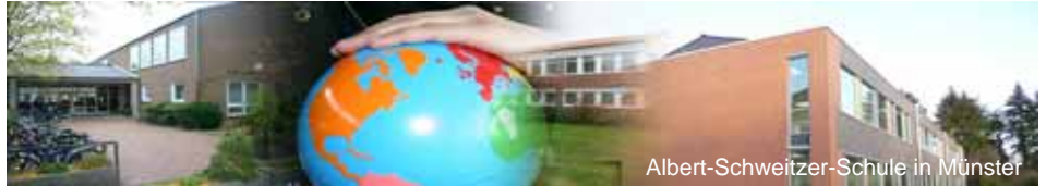
Albert-Schweitzer-Schule in Münster