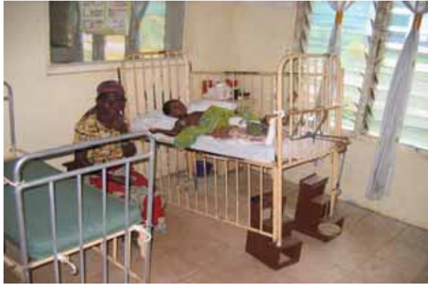
St. Anthony's Hospital in Dzodze / Ghana schicken konnte.

Darum war vor drei Jahren die Freude groß, als die aa/D mehrere, in Deutschland ausrangierte, jedoch noch sehr gut erhaltene Betten an das