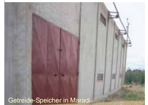
Getreide-Speicher in Maradi