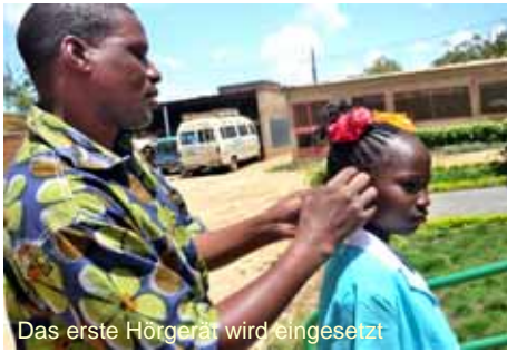
Das erste Hörgerät wird eingesetzt