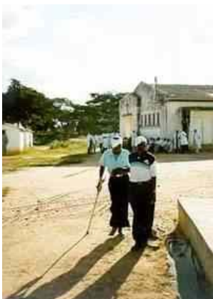
Blinder auf dem Weg zur Augenoperation in Luena

CAPDC – Centro de Apoio à Promocao e Desenvolvimento de Comunidades ist eine Nichtregierungsorganisation in Luena und in Angola auf regionaler Ebene tätig. Sie wurde von unserer Partnerorganisation medico international und anderen Vertretern der lokalen Zivilgesellschaft gegründet. In Zusammenarbeit mit verschiedenen Partnern unterstützt medico international in Angola seit 1996 Kriegsopfer.