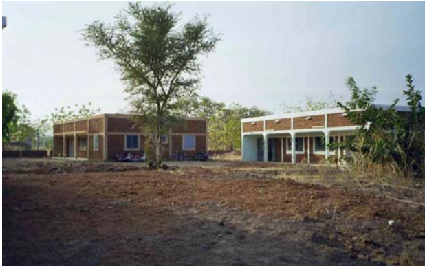
Augenklinik und Optikwerkstatt in Diébougou

„Der Herr öffnet den Blinden die Augen. Er richtet die Gebeugten auf.“ Psalm 146,8