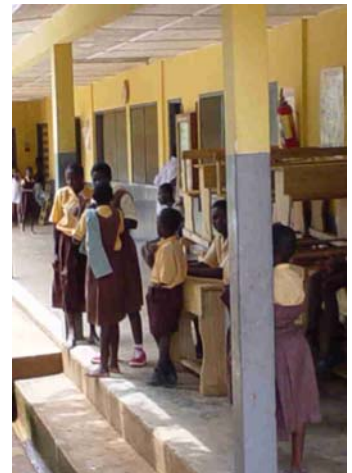
Schüler der Korforidua-Schule

Die PraktikantInnen zeigen großes Engagement bei kulturellem Austausch und fachlicher Zusammenarbeit. Sie entwickeln gemeinsam mit StudentInnen der Universität Winneba an ihren Projektschulen