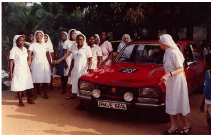
Übergabe von zwei Spendenautos an die OLA-Schwestern