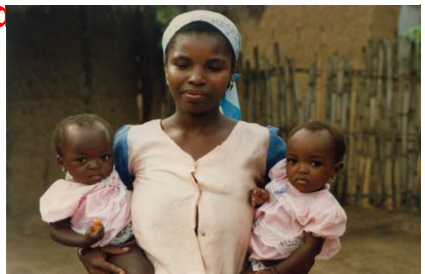
Mutter mit Kindern aus der Volta-Region in Ghana