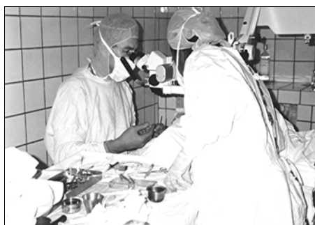
und beim Operieren im neuen Operationssaal

Liebe Mitglieder, Förderer und Freunde der aa/D