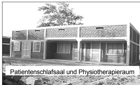
Patientenschlafsaal und Physiotherapieraum

Es wurden viele neue grundsätzliche Dinge zum besseren Funktionsablauf in der Klinik besprochen und fest vereinbart. Auch das Kommunikationssystem zwischen den Verantwortlichen und mir wurde neu geordnet. Es ermöglicht jetzt schnelle Zugriffe für beide Seiten bereits im Vorfeld weit vor den Einsätzen. Die Medikamentenbeschaffung in BF wurde diskutiert und einiges bereits er