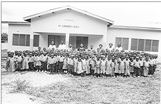
Kinder und Lehrerinnen der Pre-School vor der St. Liborius-Hall