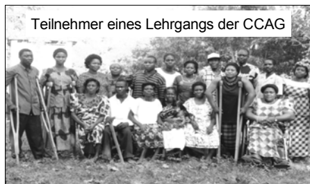
Teilnehmer eines Lehrgangs der CCAG

Interessenvertretung Behinderter auf politische Entscheidungen Einfluß zu nehmen, gemeinsame Aktivitäten zum Wohle von Behinderten durchzuführen.