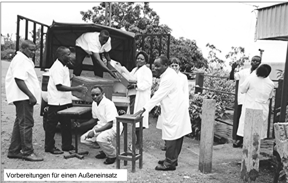
Vorbereitungen für einen Außeneinsatz

Das ist die häufigste Ursache für Blindheit in Afrika. Mindestens die Hälfte aller Blinden erblindete aufgrund der vollständigen Eintrübung der Augenlinse. Die Patienten sehen nur noch wie durch Milchglas. Im schlimmsten Falle können sie nur noch Hell und Dunkel unterscheiden.