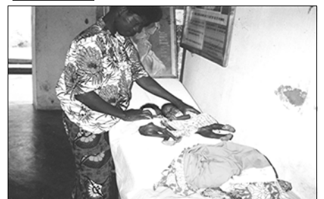
Mutter mit neugeborenen Zwillingen in der Station