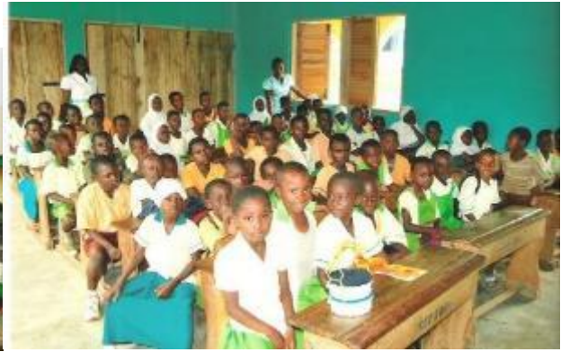
Die neuen Klassenräume

Seit 2012 unterstützt die Stephansgrundschule in Konstanz mit verschiedenen SMV-Aktionen die Bantama Grundschule in der Millionenstadt Kumasi in Ghana / Westafrika.