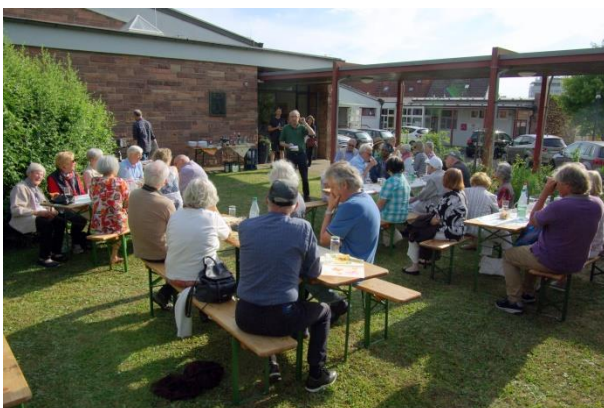
Sommerfest in St. Michael